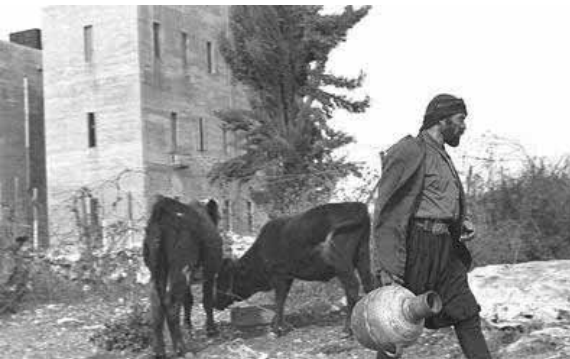
مركز البوليس ١٩٤٩