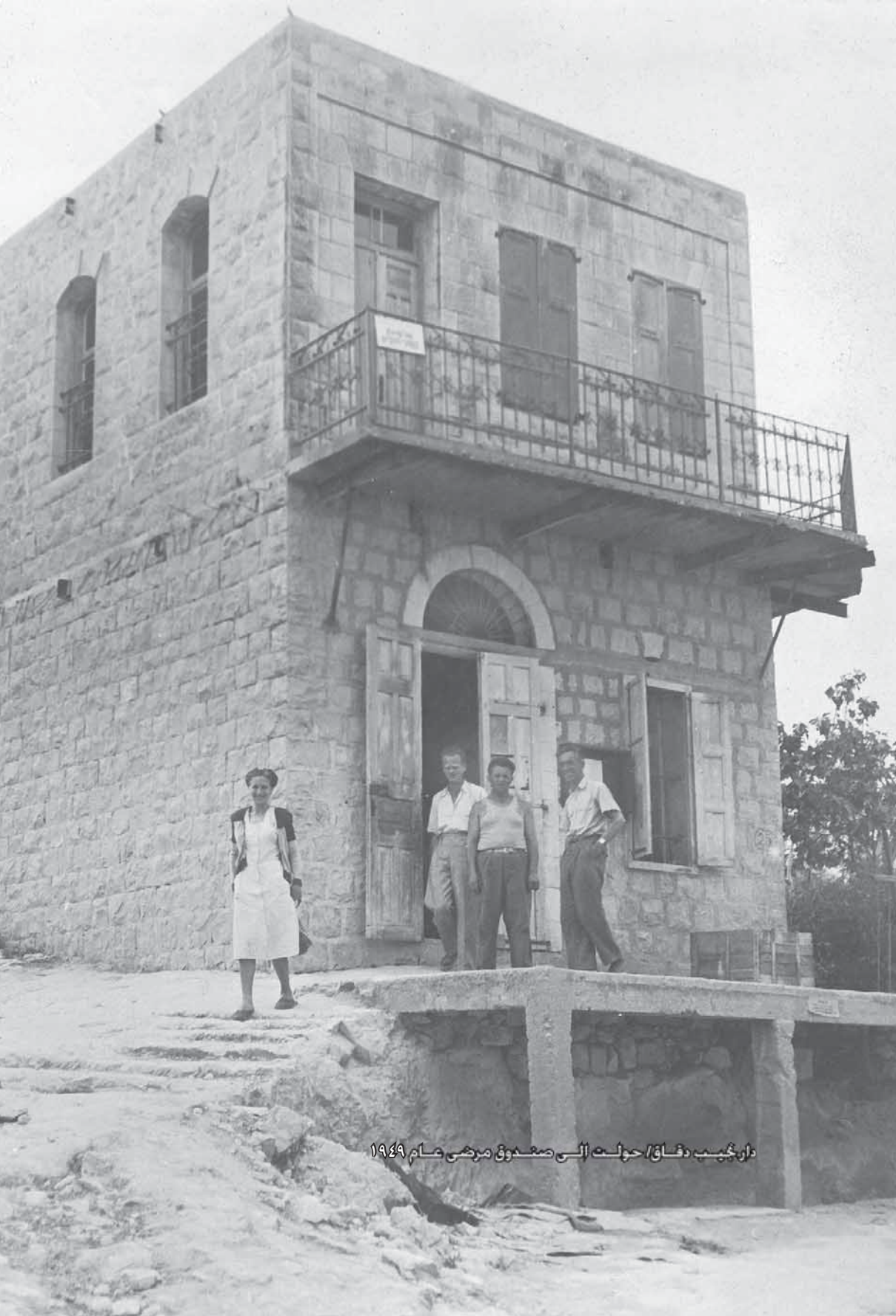
دار نجيب دفاق / حوت الى صندوق مرضى عام ١٩٤٩