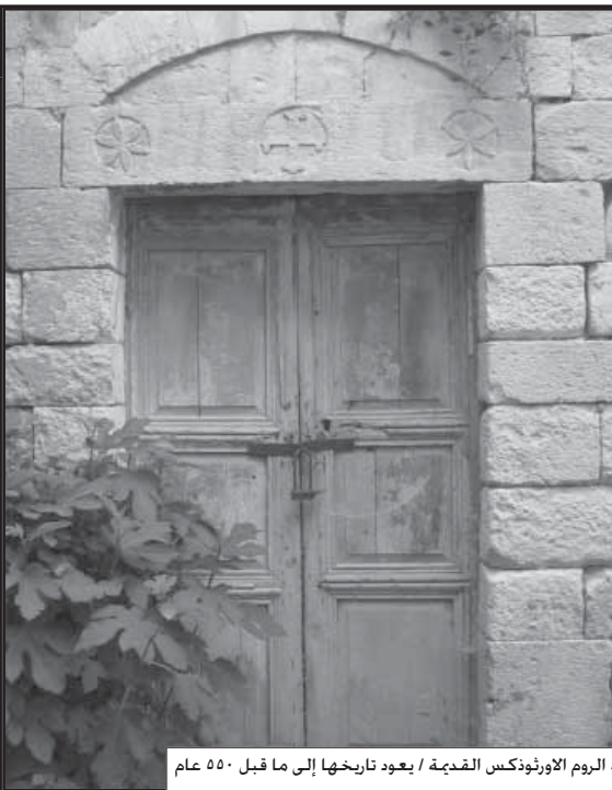
مدخل كنيسة الروم الاورثوذكس القديمة / يعود تاريخها إلى ما قبل ٥٥٠ عام

تقع قرية ترشيحا على جبل المجاهد شمال فلسطين في الجليل وتُحَدِّدُ في قسم الجليل الغربي. تبعد ١٦ كم عن شاطئ البحر المتوسط شرقاً، و٢٥ كم عن الحدود اللبنانية جنوباً. و٢٧ كم عن عكا باتجاه شمال شرق . تجاور ترشيحا قرية معليا. فسوطه، حرفيش، البيقعة، يانوح، كفر سميع وسحماتا المهجرة وقد اقيم على اراضيها ما بعد سنة ١٩٤٨ مستوطنة معالوت، معونة، حوسن، عين يعقوب، جدين، جعتون وغيرها. ترتفع ترشيحا عن سطح البحر حوالي ٦٠٠ متر وهو ما يميّز مناخها. كما وتعتبر منطقة مواصلات هامة اذ تمر بها جميع الطرق الواصلة بين القرى التي ذكرناها. ما جعلها ويجعلها مركزاً للكثير من الاعمال، الخدمات، البيع والشراء بالإضافة لسوق البلد الذي كان يقام في شوارع البلدة القديمة والذي ما زال يقام اليوم في شارع السوق في مدخل البلدة. كان عدد سكان ترشيحا سنة ١٩٢٢ ما يقارب ١٨٨٠ نسمة ووصل سنة ١٩٤٨ الى ٥٧٠٠ نسمة. وهو اكبر من عدد سكان البلدة اليوم البالغ ٤٥٠٠ نسمة.