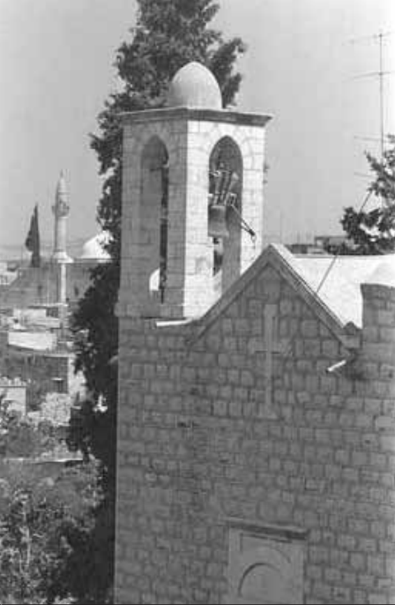
كنيسة الروم الأرثوذكس / بنيت عام ١٩١٣