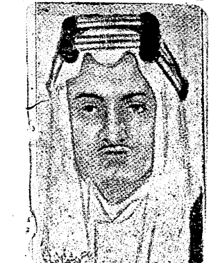
سرو الامير فيصل السعودي

بيروت في ٢٦ - ٢٦ - ٢٦ ووقع نعيم رئيس الوفد اللبناني في سانت فرانسيسكو يقول: ان الوفود العربية - مسافرا الى نيويورك يوم ٢٨ حزيران في طريقها الى الوطن واستعمل الوفود الى البلاد العربية بين ١٢ تموز و ١٥ منه لندن في ٢٦ - ٢٦ - ٢٦ منتدوي لبنان وللملك العربية السعودية في