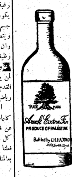
اشربوا العرق المرروب ماركة بردى حداد ماركة البعبع الأوشهي واقي كونيالك