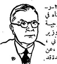
خطاب وزير المستعمرات نيويورك في ٢٠-٢-٤٥