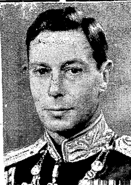
باريس في ٢٠ - ر.ع.م. ذكر برنارد فاري في جريدة «فرانس سوار» ان كتابا كانت