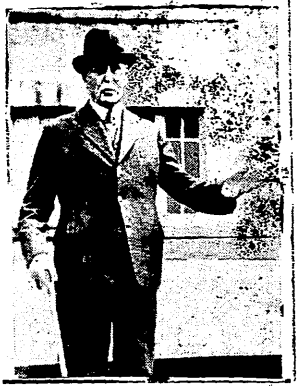
المرشال بيتان اليوم الثاني

محاكمة المارشال بيتان في يومها الثاني - بول رينو يبدى بشهادته أمام لجنة التحقيق في مسألة بلدية القدس الكشف عن الاسرار الخطيرة التي اكتنفت سياسة فرنسا عندما حلت ساعة الرهينة حملة الصحافة على المارشال العجوز واتهامه «بالخيانة» - بيتان يقابل الاتهامات بالهدوء!