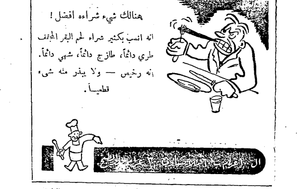
أكبوا والمبلوا كراسات الوصفات من دائرة مراتب المواد الغذائية العامة صندوق البريد ١٢٤٨ القدس

الاحد ٢١ - ١٠ - ١٩٤٥ - الموافق ١٥ من القعدة سنة ١٣٦٤ ٧ قرأت كرم - الشيخ سعد ٧٢٠٠ الاخبار ٧٣٥٠ رادوية الصباح ٧٤٥ برنامج اليوم ٧٥٠٠ موسيقى احمد صبره ٨ ختام ٨٢ برنامج المرأة بدوية - نثر وشعر وموسيقى لالاسنة هزيت سكة (٢) فوائد منزلية (٣) موسيقى مختارة ١٢٣٠٠ الاخبار ١٢٤٠ موزال «عن الحجاب» مجد المطلب ١٢٥٠ مزار وشباب ١٢٥٠ برامج احمد ١ اشوددة الحاج لكلام محمود ١١٣٠ اغل من قبل (تشيد الامل) ١٣٥٠ اغان خفيفة ١٤٥٠ ثنائي رقيق وسهام ديولوجات ٢ اخبار ١٣٥٠ زاوية للستين ٢٥٥٠ ام طاب برنامج مساء ٣ ختام ٤ برنامج النساء ٥ دور انترام في القلب - لتفجحه احمد ٤٣٥٠ موسيقى راقصة ٤٤٠٠ اغنية (أهي كلمة) عبد العزيز محمود ٥ حديث اليوم ٥٥٠ سماد مكايي مونولوجات ٥١٥ اغنية (تالي تيش) نظم امير الشراء احمد شوقي بك تلحين وفتاح مجل السكار - تفاح لاول مرة ٢٨٠٠ اغان لام كلثوم ٤٥٠ اغنية (خلي الدنيا تحبك) مابر وموال (الوردة) مجل فوزي ٦ الاخبار ٦١٥٠ اغنية (خلي الدنيا تحبك) مابر والصح ٦٣٥٠ انترام الكرم - الشيخ السندوني ٧ قات الصح ٧١٠ مختارات غنائية ٧٣٠٠ طابا المرعي بلم عرود ٧٤٥٠ قطرة (مبين اسد مني) آمال حسين ٨ الاخبار ٨١٥٠ قانون عمر الفندي ٨٢٥٠ الشيخ سيد درويش - اسطوانات ٨٤٥٠ اغنيات متنوعة مسجلة ٩ ختام