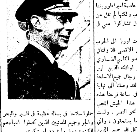
الملك جورج السادس