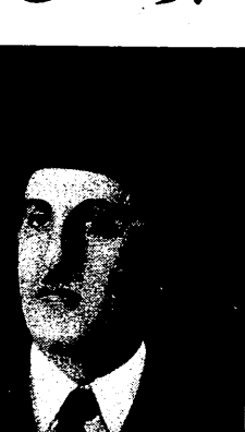
فخامة شكري القوتلي

القاهرة في ١٩ - ر - استقبل النقراشي باشا رئيس الوزارة اليوم اللورد كيلرن السفير البريطاني