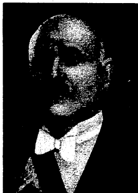
فخامة الشيخ بشارة الخوري

من فرنسا لفرس طلباتها مع التهديد بالقوة . على انهم يأملون في الدوائر المصرية والبريطانية هنا ان يسود حسن النية وتوسى جميع المسائل المعلقة بين بلاد الشام وفرنسا توية حنة وكل ما به بريطانيا في هذا الامر هو الامن العام في الشرق الاوسط والاتشاش الاقتصادي لسوريا ولبنان واما مصر فانها ترغب بوصفها من زعمات الجامعة العربية ان ترى هذا الخلاف وقد سوي بعد اذ طالب عليه الامد واشتركت سوريا ولبنان كل الاشتراك في مهمة انشاء الجامعة العربية التطلع الى بريطانيا