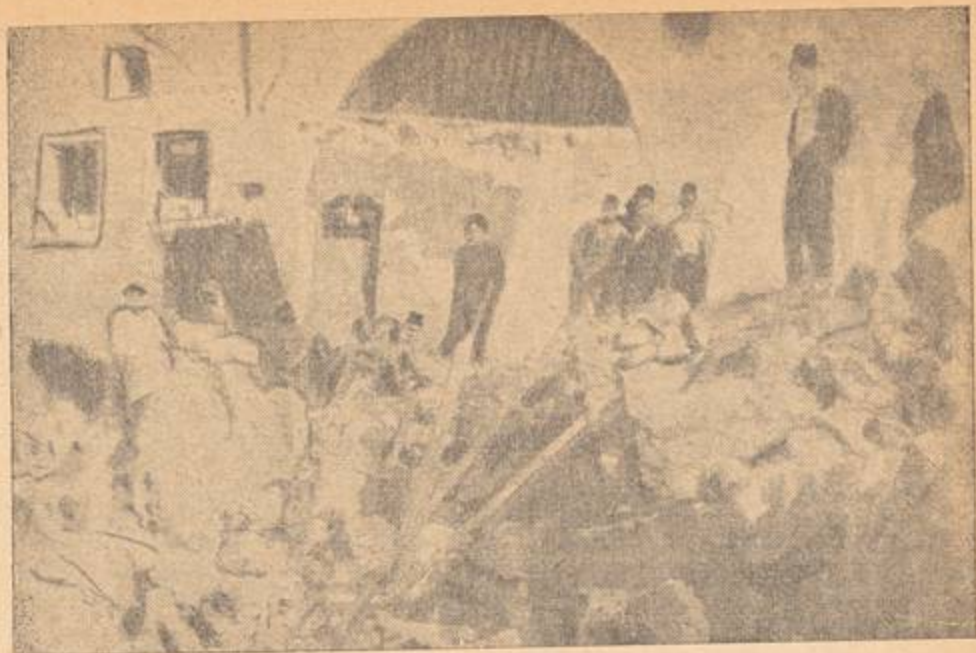
نسف المنازل بالقنابل والديناميت

تضمن المنشور أيضاً مطالبة السلطات البريطانية لأهالى المدينة بالعمل على إخلاء منازلهم .