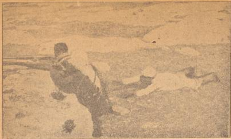
بعض الشوار يترصدون الجنود والقوافل اليهودية