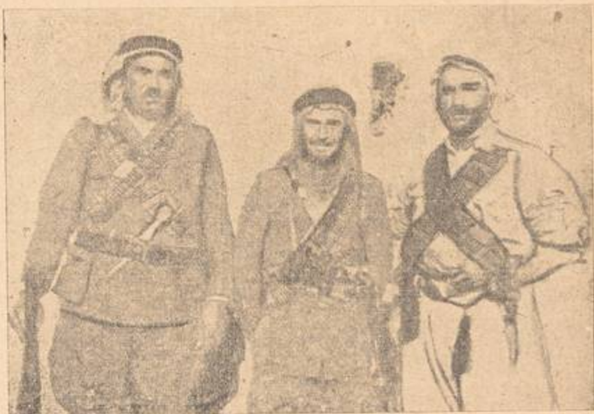
القائد عبد القادر في الوسط

كان أول من استلم القيادة العامة للثورة في منطقة القدس البطل المشهور عبد القادر الحسيني سنة ١٩٣٨ . وأول ما قام به أن أجرى عدة إتصالات مع الفدائيين الأحرار داخل مدينة القدس وهم الذين سطروا في عالم الجهاد أمثلة رائعة في التضحية والفداء في جبال القدس وبيت لحم ورام الله قبل أن يتصل بهم القائد عبد القادر الحسيني . وعندما خرج من معتقله في شهر أيلول سنة ١٩٣٦ إشتراك في معركة الخضر حيث جرح فيها ثم أسر . وهنا برز إسمه بين المجاهدين بوصفه أول شاب مثقف ثقافة جامعية يساهم في الثورة والقتال . وأخذ إسمه يلمع تدريجياً عندما قام مع عدد من أبناء قضاء القدس البواسل