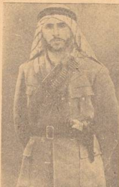
الشهيد الشيخ عبد الفتاح أبو عبد الله

رحم الله ذلك القائد الشيخ عبد الفتاح ذلك الإنسان البطل . لقد عرفته مجاهداً قويا ، وثائراً مؤمناً ، لقد كان مثلاً للشهامة والجرأة ، وكان يميل في حياته الخاصة إلى الصمت والتفكير الطويل الهادئ . وكان يتخمس تفكيره دائماً عن خطط ناجحة لأنه كان بقلبه وعقله للثورة وأهدافها السامية .