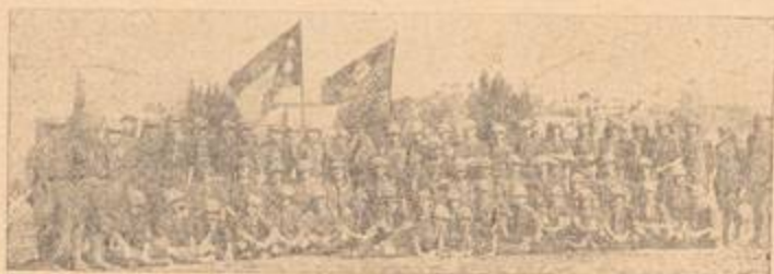
احدى فرق الكشافة العربية

وفي صباح ٢٠ - ٤ - ١٩٣٦ ، أضربت مدينة يافا بكاملها بما في ذلك الميناء وقامت مظاهرات كبيرة في حي المنشية ، اشترك فيها الآلاف من سكان مدينة يافا المجاهدة ، ثم قام المتظاهرون بهجوم على الحي اليهودي وقتلوا خمسة من اليهود وجرحوا ستة وعشرين ، واستشهد برصاص البوليس وياشراف مدير البوليس نفسه ، كفاراتا ، بطلان عريبان وجرح إثنان وثلاثون وكانت جراحهم بسيطة . وهكذا أخذت تتفاقم الاضرابات يوما عن يوم . وعلى أثر الحوادث تألفت فرقة من الكشافة المتجولة الإسلامية