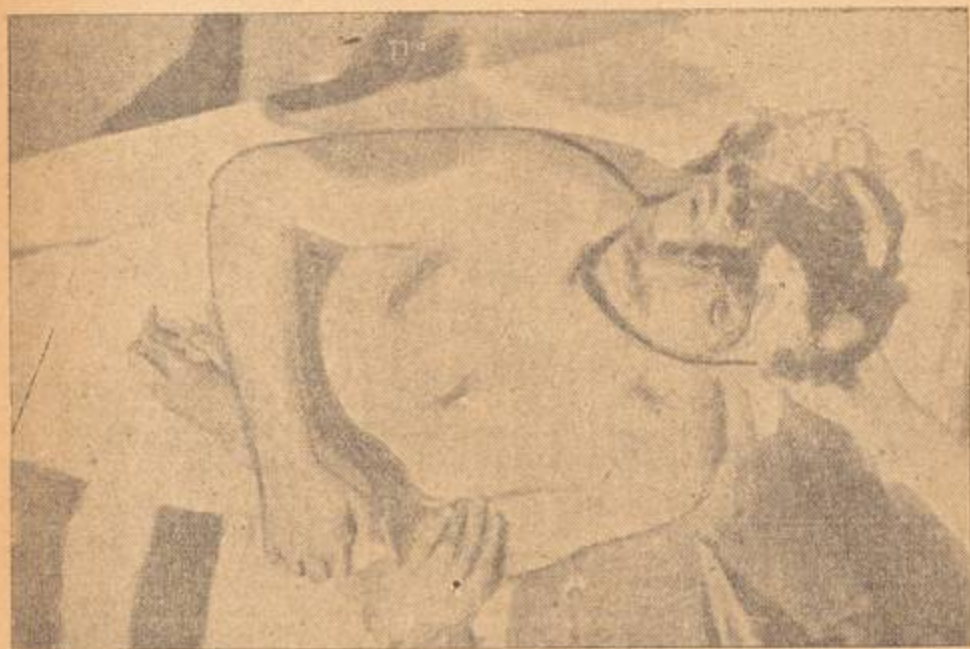
أحد ضحايا الثورة العربية في فلسطين