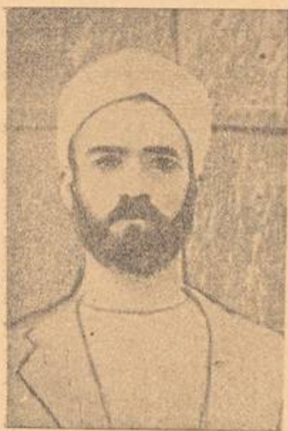
« الشهيد الشيخ عبد الحفيظ أبو الفيلا » مؤسس الثورة فى منطقة الخليل

أما مدينة بيت لحم — مهد السيد المسيح عليه السلام — فهى البلد التى ساهمت أيضاً فى الإضراب منذ البداية حتى نهايته ، وشاركت فى أعمال الثورة فى هذه البقعة من فلسطين الحبيبة . ولا بد لنا من ذكر المجاهد البطل إبراهيم خليف الذى كان أول بطل يؤسس فصائل ثورية تعمل فى الجبال المجاورة يساعده فى ذلك البطل الشهيد عيسى أبو قدوم من عرب التعامرة .