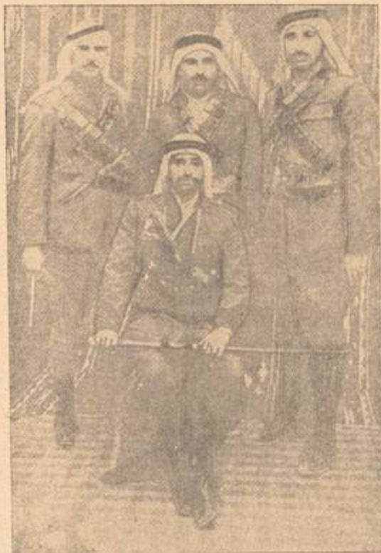
(١) القائد الشهيد الشيخ يوسف أبو درة وخلفه أركان حربه .

نابلس ، وكلا القائدين الكبيرين من إخوان الشهيد القسام ، ومن الثوار الأحرار الذين تعاونوا معهما منذ البداية : -