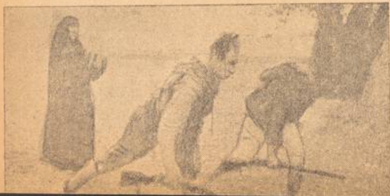
المرأة العربية تلحق بالمجاهدين في الجبال