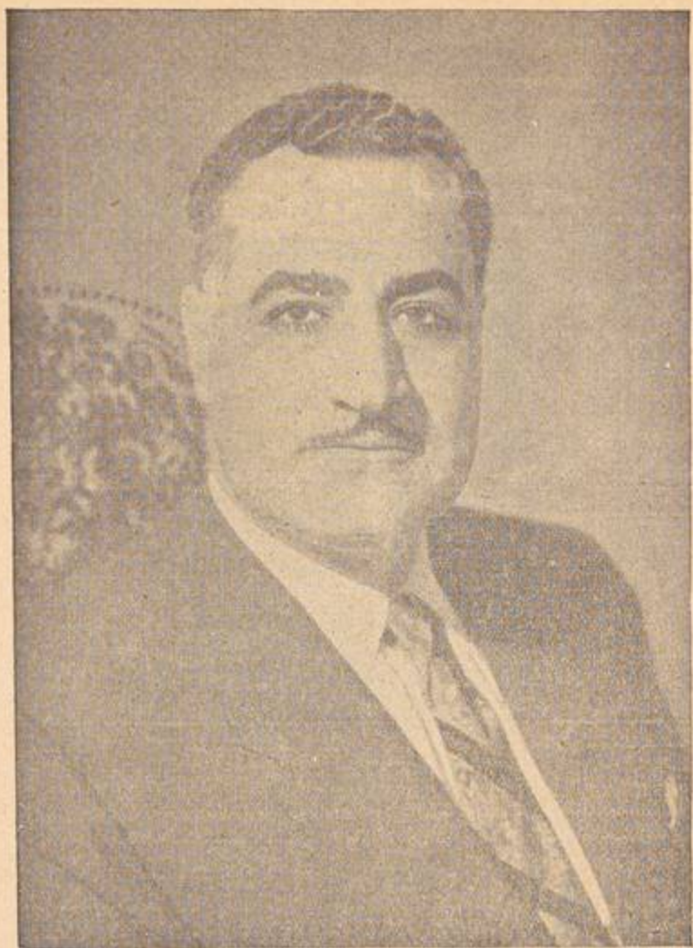
رائد القومية العربية السيد الرئيس جمال عبد الناصر