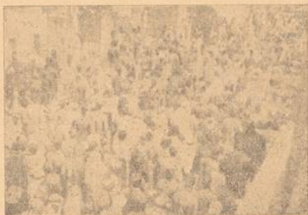
احدى مظاهرات الشعب العربي الحر

( ٢ ) ساد القلق على المصير المحزن الذي ينتظر الوطن والشعب من جراء سياسة الانسكيز التي ترمي إلى جعل فلسطين وطناً قومياً لليهود فاندلعت في مدينة يافا العربية الياسلة ثورة جديدة استمرت من ١ إلى ١٥ آيار ( مايو ) سنة ١٩٢١ انقض فيها الأحرار العرب على مركز المهاجرة الصهيوني وقتلوا عدداً من المهاجرين اليهود وفي تلك الأثناء هاجم أفراد الشعب للمستعمرات اليهودية بين يافا وطولسكرم وخاصة مستعمرة ملبس حيث قتل وجرح أكثر من مائتي يهودي واستشهد عشرات