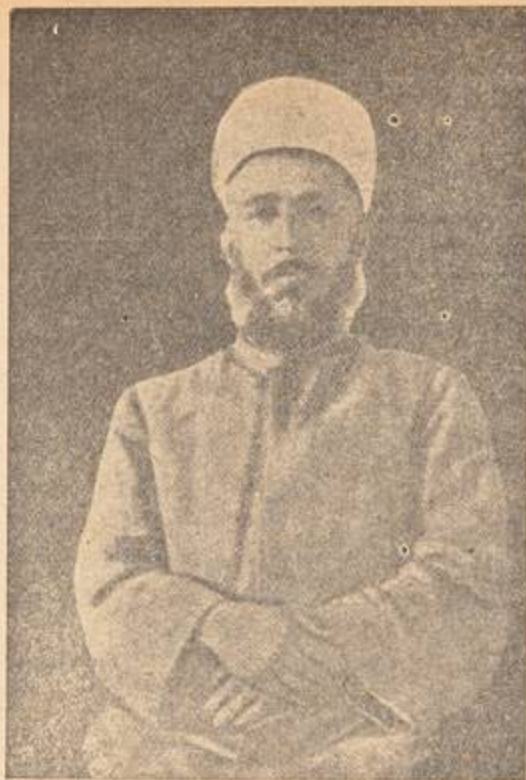
الشهيد الشيخ عز الدين عبد القادر القسام