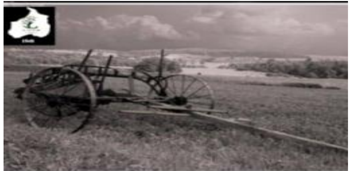
حصادة ميكانيكية تجرها الخيول