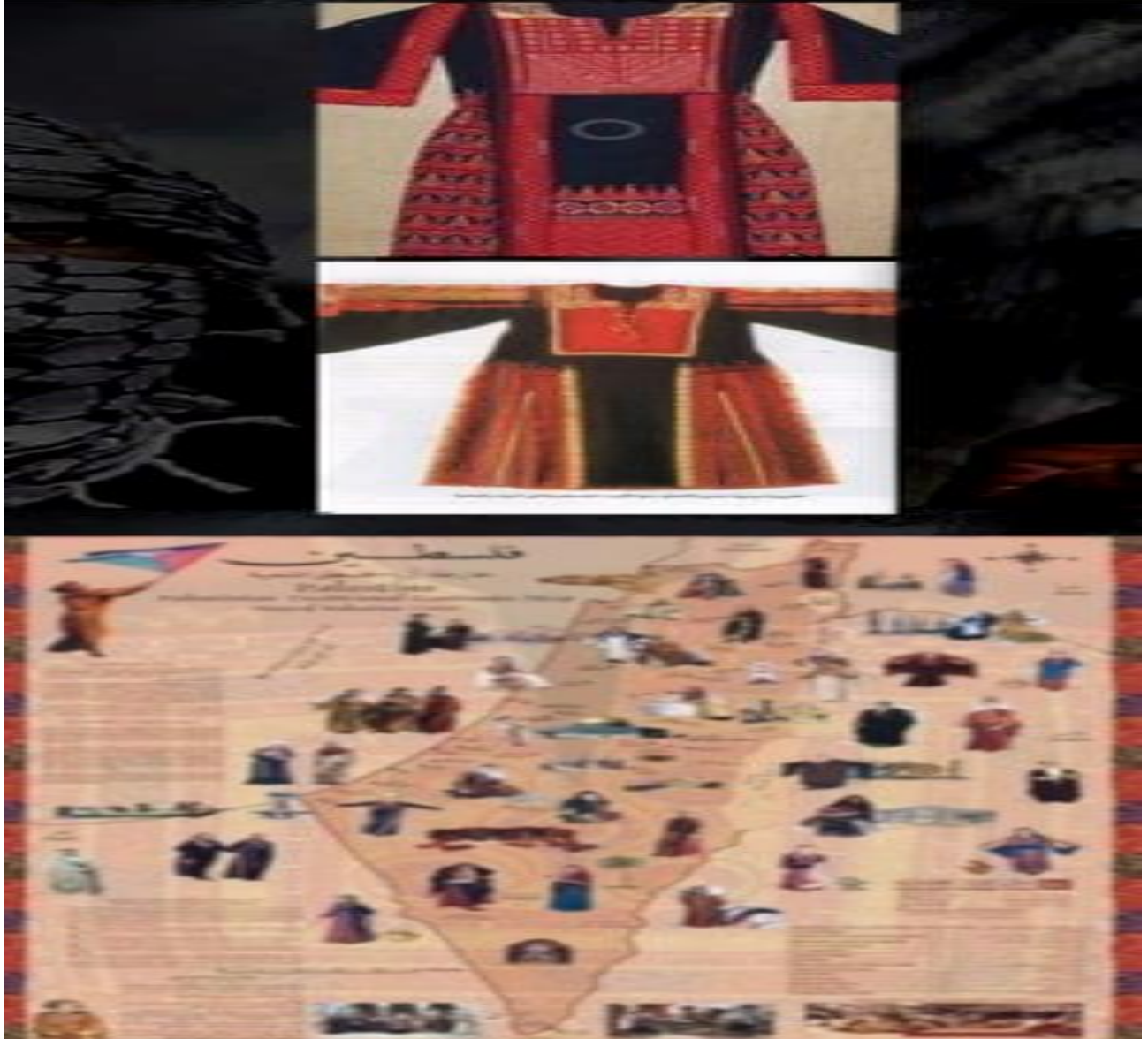
صور شكل رقم [٧]