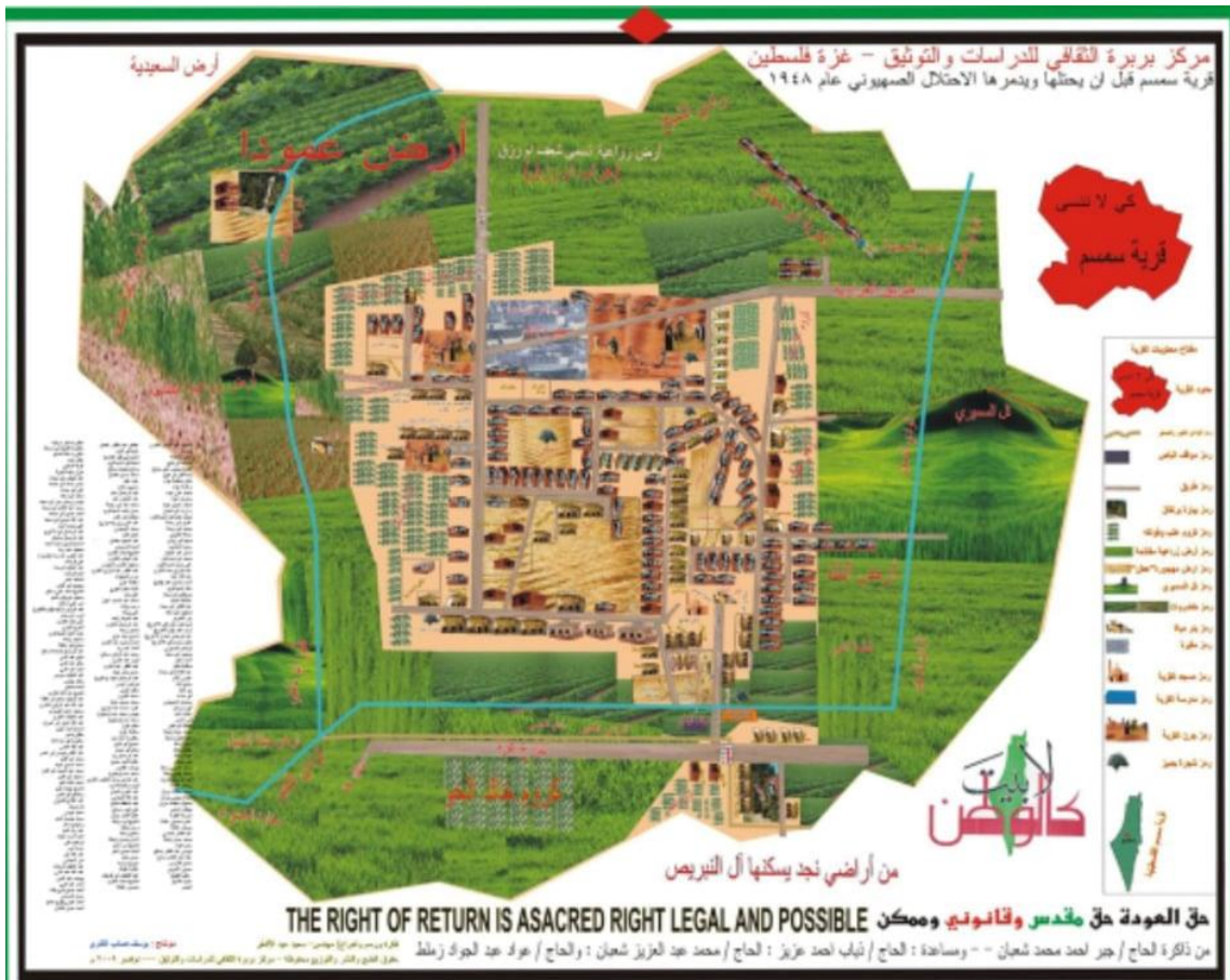
شكل رقم [1]: قرية سمسم 1948م