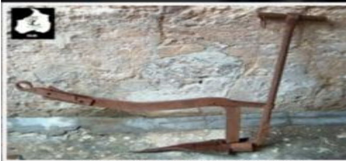
الخرات الحديدية والتي لا يزال يستخدمها الفلاحين الى اليوم