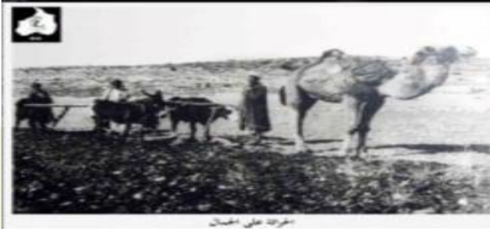
الخرات على الجمال