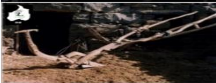
الخرات الخشبي المستخدمة قديما، لم يعد له وجود في فلسطين