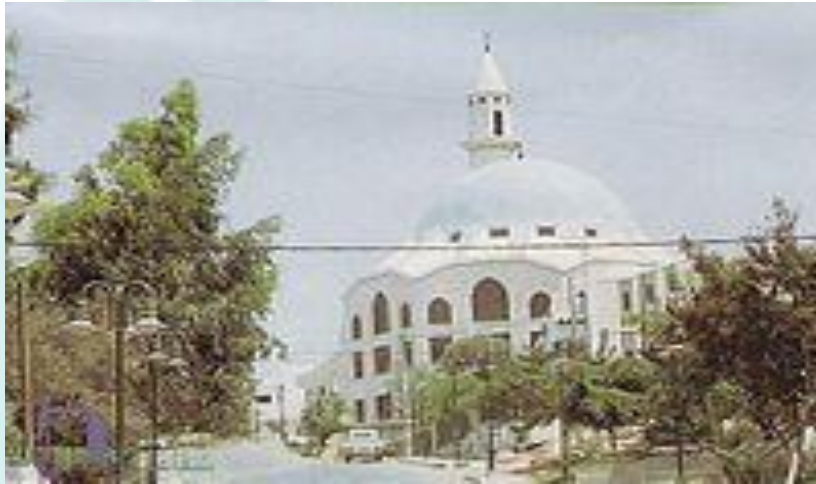
مسجد عمرو بن العاص حي الميدان