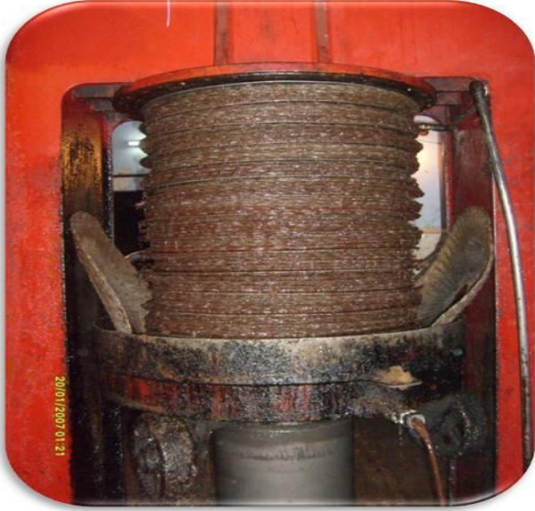
مكبس عصر زيتون