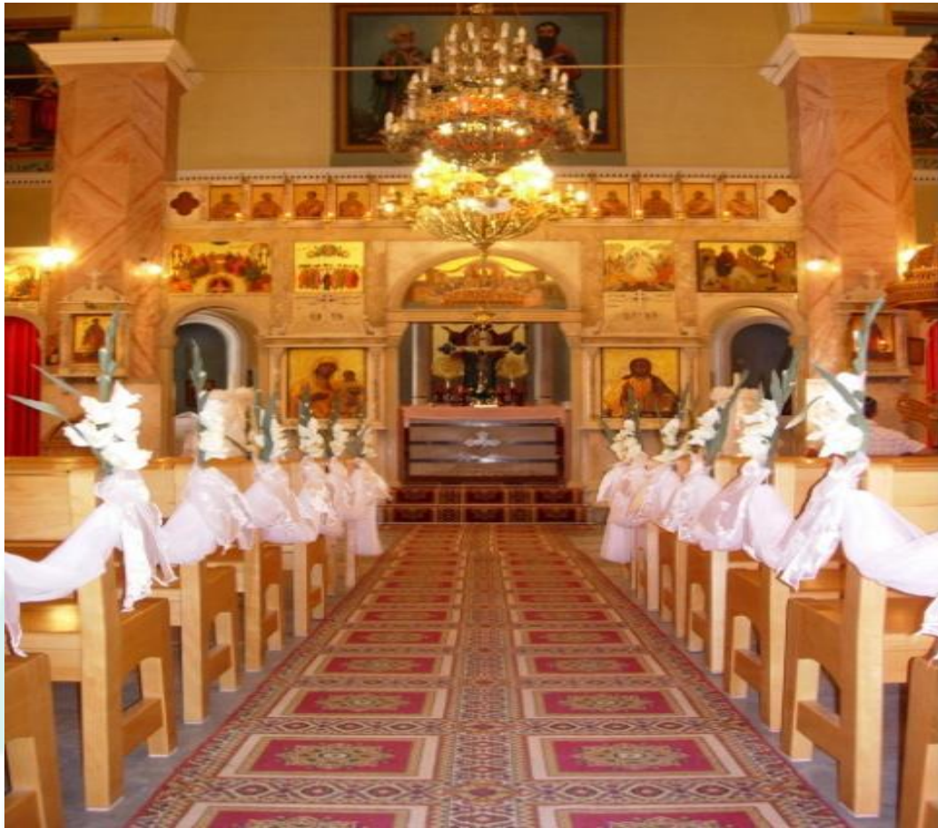
كنيسة بطرس وبولس

تقع في أعالي المدينة وهي ذات قبة وبرج أجراس عالي وقد سميت على اسم القديسين بطرس وبولس المعروفين في التاريخ المسيحي. بنى هذه الكنيسة عثمان إزكان قد نذر نذرًا أنه إن توفق في بناء قلعته فسوف يبني كنيسة للروم الكاثوليك ويعود تاريخها إلى زمن القلعة. لقد بدأت جدران الكنيسة بالتلف في بداية القرن الـ 20 لذلك تمّ ترميمها وتقويتها سنة 1904م وهي ما تزال صامدة حتى هذا اليوم.