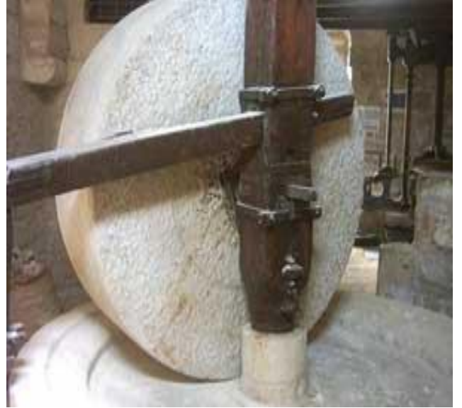
دولاب حجر للعصر

وقد انتشر العمران في مدينة شفا عمرو وقد ساعد على تطور البناء ما يلي: